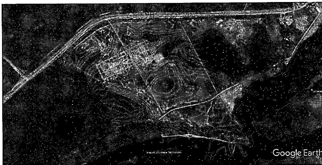
octubre 2021

La zona de construcción de las estructuras está clasificada como zona de inundación alta, por lo que, de acuerdo con el documento presentado, la construcción del Jarillón con una cota máxima de 15,20 msnm evita que la lámina de agua llegue hasta las edificaciones proyectadas de forma directa.