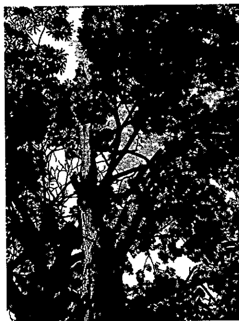
Ilustración 1. Árbol solicitado para intervención.

Teniendo en cuenta las observaciones expuestas anteriormente, se considera Viable otorgar Permiso al solicitante para efectuar TALA del árbol de nombre común Roble ( Quercus humboldtii ) , ubicados en la plaza principal de Santa Rosa - Bolívar, en las coordenadas geográficas: Árbol 1. 10°26'37.91"N 75°22'13.64"O , con el fin de evitar accidentes por la posible caída de las ramas; todo ello de conformidad al ARTÍCULO 2.2 1.1.9.3. Tala de emergencia, DECRETO 1076 DE 2015.