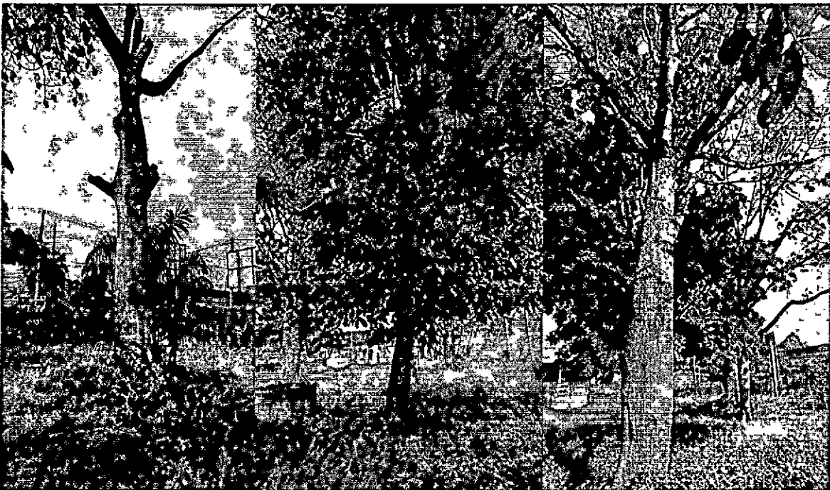
Imagen 2. Árboles de diferentes especies a intervenir