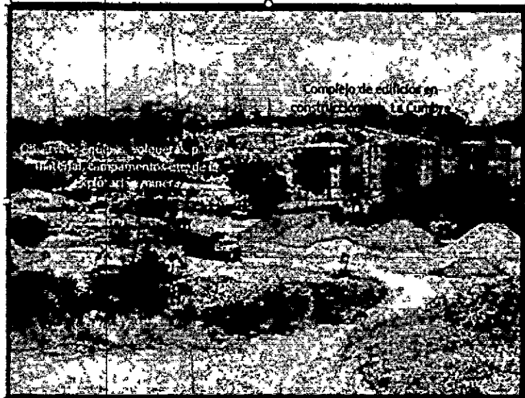
Ilustración No.1. Obsérvese el complejo de edificios de la Urbanización La Cumbre, al lado de la explotación minera.

"POR MEDIO DE LA CUAL SE APERTURA UNA INDAGACIÓN PRELIMINAR Y SE DICTAN OTRAS DISPOSICIONES"