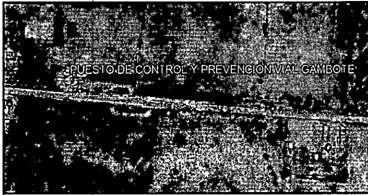
Imagen No 1. Operativo de Control al Tráfico Ilegal de Flora Silvestre en Coordenadas Geográficas (10° 08' 12"N - 75°16'07"W)

"POR MEDIO DEL CUAL SE LEGALIZA UNA MEDIDA PREVENTIVA, SE INICIA UN PROCESO SANCIONATORIO AMBIENTAL Y SE DICTAN OTRAS DISPOSICIONES"