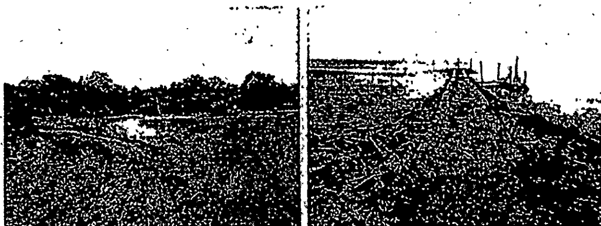
Espolones en piedra y concreto.

De igual manera se observaron tres (3) espolones construidos con piedra y concreto, que según el señor Manuel Polo Castaño, sirven de protección costera.