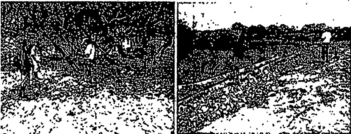
Encerramiento de cuerpo de agua. Imagen tomada del expediente SA 9647-2