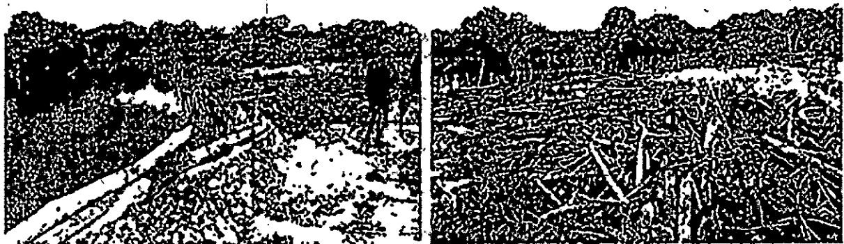
Encerramiento y relleno del cuerpo de agua.