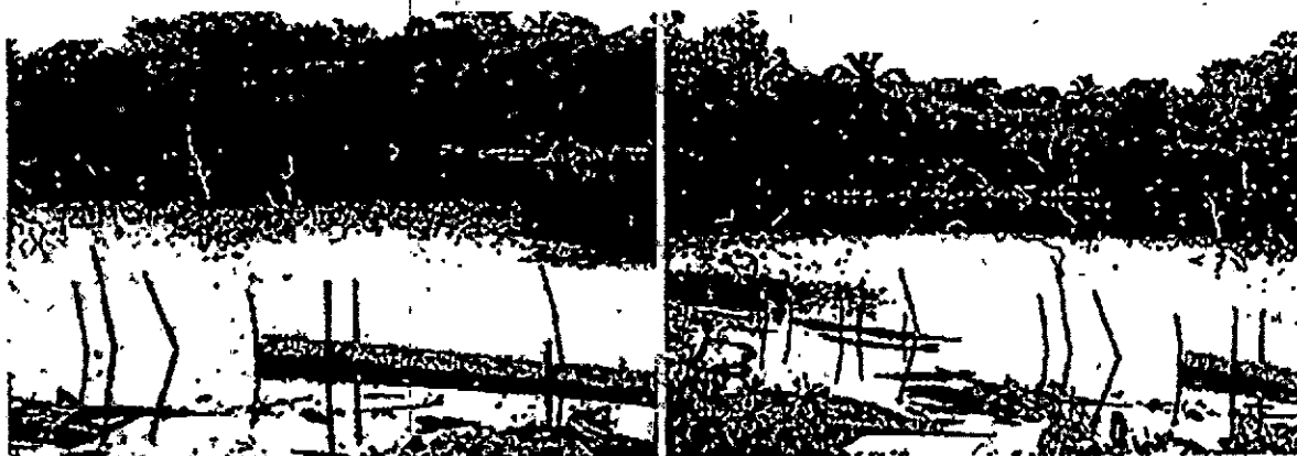
Laguna costera encerrada y mangle muerto. Imagen tomada del expediente SA 9647-2

"POR MEDIO DEL CUAL SE INICIA UN PROCESO SANCIONATORIO AMBIENTAL Y SE DICTAN OTRAS DISPOSICIONES"